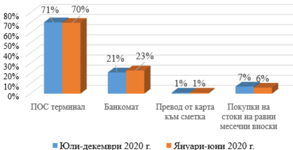
Таблица 2: Използване на кредитните карти

Според данните от проучването в периода юли-декември 2020 година средният размер на трансакциите на ПОС терминал е 53 лева, което е повече в сравнение с първата половина на годината, когато беше 48 лева. От банкомат хората теглят средно 147 лева, което е ръст от 2 лева в сравнение с януари-юни 2020 година.